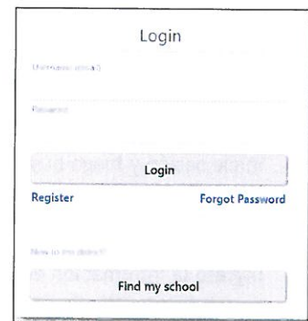
Pantalla de inicio de sesión